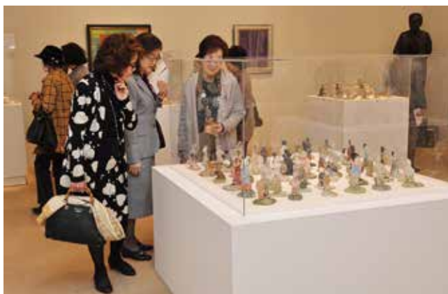
陶人形を鑑賞する参加者

鑑賞後、癒しと食の複合リゾート施設「アクアイグニス」に移動し、イタリア料理のフルコースを楽しみ、会員同士の親睦を深めました。