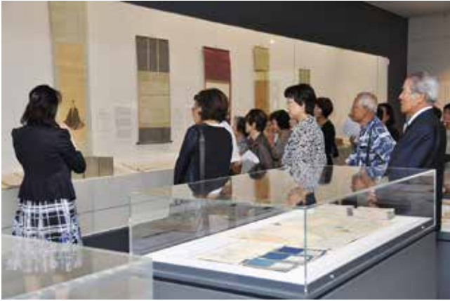
学芸員(左端)の解説を聞く参加者

研修後は、半泥子が好んで通ったという同館近くの料亭「はま作」で昼食を楽しみ、会員同士の交流を深めました。