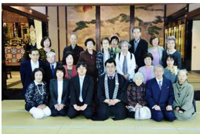
僧職らの案内で拝観した参加者

拝観後は、一身田寺内町の寺社建造物や文化財などについてガイドボランティアから説明を受け、昼食を楽しみ、会員同士の親睦を深めました。